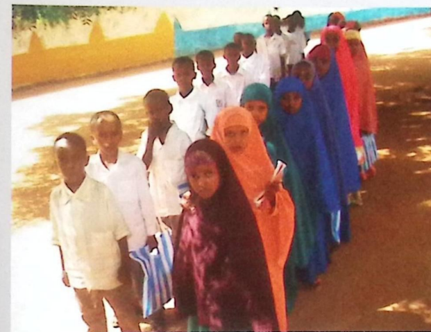
Alunni Scuola Dinsor - Somalia

Centro di Collaborazione Comunitaria Organismo di Cooperazione Internazionale